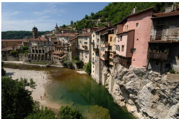
Pont en Royan

Les grands Goulets, mais on est obligé de passer par le tunnel (snif)