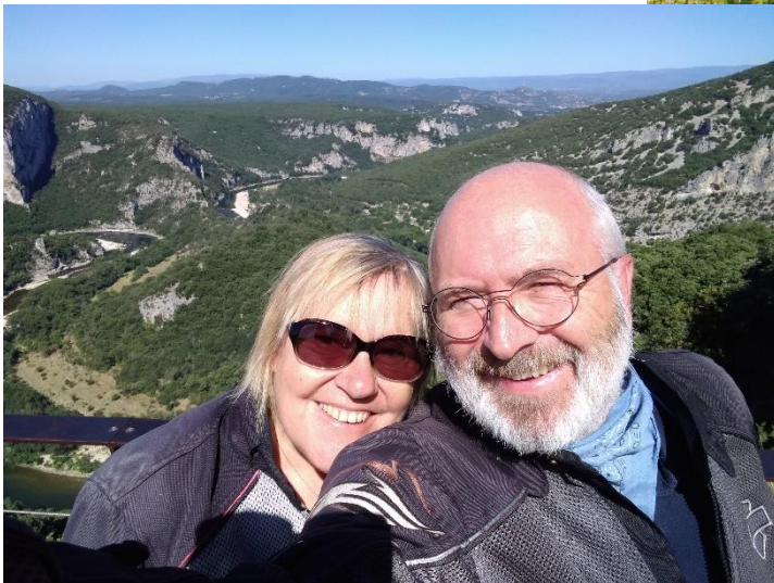
Gorges de l'Ardèche

On traverse la vallée du Rhône pour Nyons et ses oliviers Terres des ancêtres d'Isabelle, Rémuzat, Cornillon Pause au col de Prémol Descente sur Die